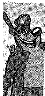
Auà" mascotte ei Giochi escatesi